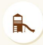
Children Play area