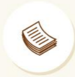
N.A. Plan Pass