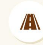
25' RCC Road