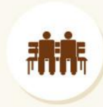
Senior Citizen sitting