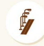
Street Light & Drainage Line